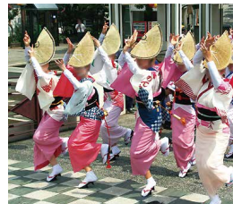
阿波踊り 徳島が一年で一番熱い夜

瀬戸内海国立公園の鳴門公園内にある「うず潮ウォッチエリア」や世界最大級とされる鳴門のうず潮は圧巻です。また、日本最大級の広さを誇る大塚国際美術館への観光もおすすめです。