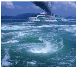
大型観潮船 わんだーなると