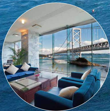
鳴門のうずしおに一番近い宿 ベイリゾートホテル鳴門海月