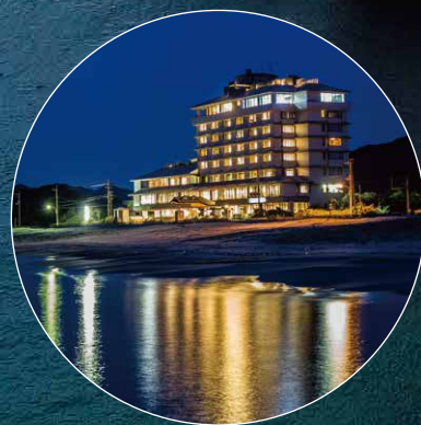
鳴門海峡を目の前に望む宿 鳴門グランド海月