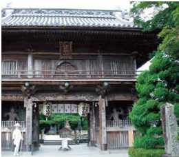
靈山寺 (一番さん) 四国八十八札所の第一番札所 お遍路旅立ちの寺