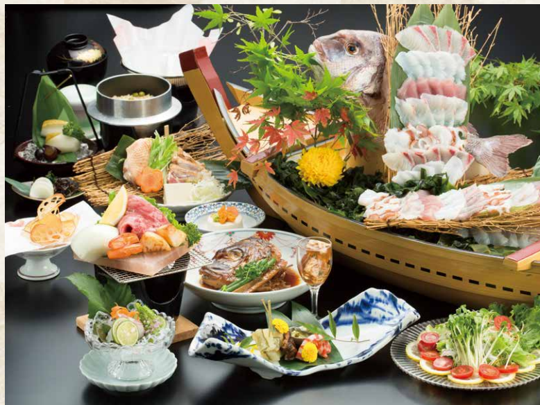
※写真の舟盛りは7名様盛りです。