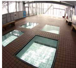
大鳴門橋遊歩道 渦の道

休 3/6/9/12月の第2月曜 営 9:00~18:00 ※10~2月 9:00~17:00 ※GW/夏休み 8:00~19:00