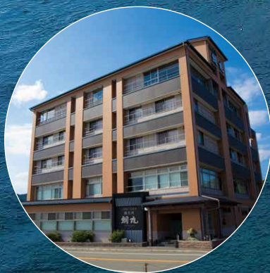
鳴門の海の幸と潮騒を楽しむ宿 鯛丸海月