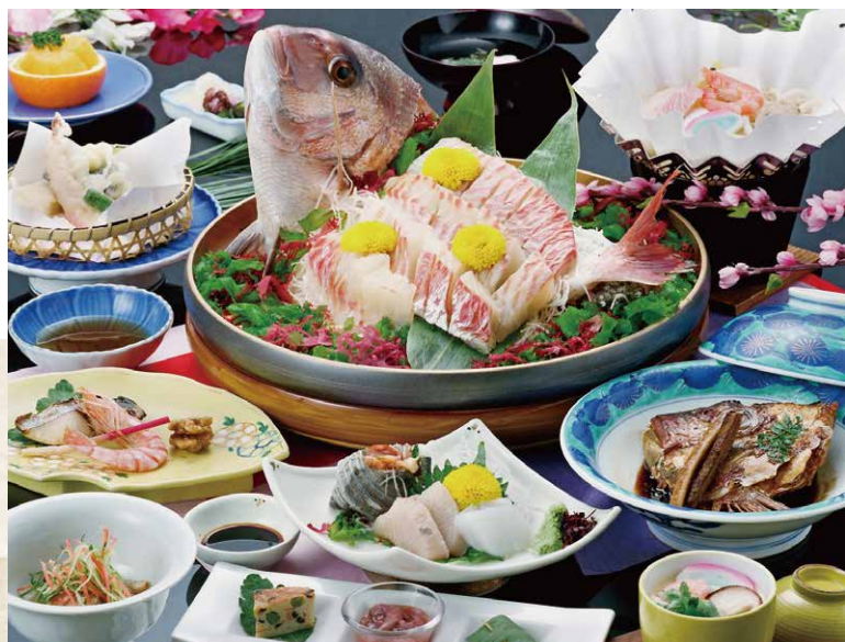
※写真の舟盛りは10名様盛りです。