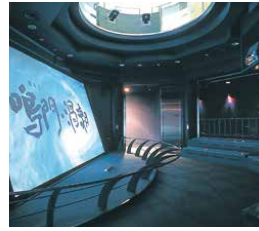
大鳴門橋架橋記念館エディ

休 3/6/9/12月の第2月曜 営 9:00~18:00 ※10~2月 9:00~17:00 ※GW/夏休み 8:00~19:00